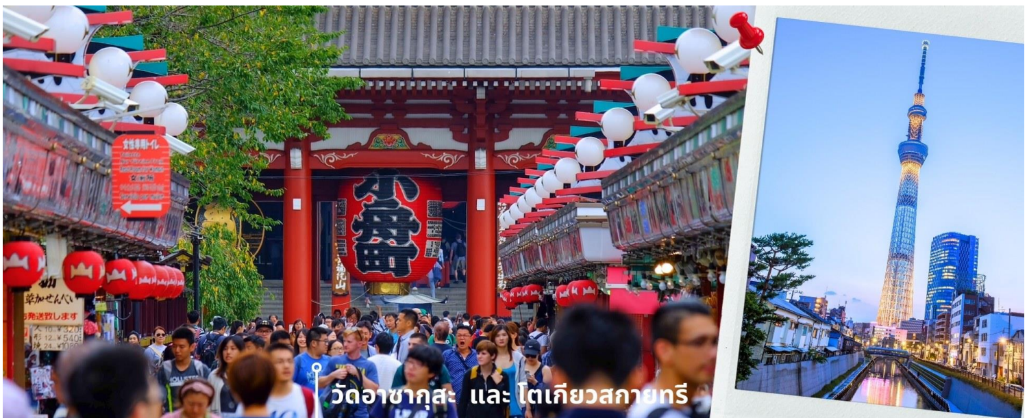
วัดอาซากุสะ และ โตเกียวสกายทรี

08.00 น. เดินทางถึงสนามบินนาริตะ ประเทศญี่ปุ่น หลังจากผ่านพิธีตรวจคนเข้าเมืองและศุลกากรแล้ว นำท่านขึ้นรถโค้ชปรับอากาศ จากนั้นเดินทางสู่ เมืองโตเกียว พาท่านสักการะ ที่ วัดอาซากุสะ (Asakusa Temple) วัดที่ได้ชื่อว่าเป็นวัดที่มีความศักดิ์สิทธิ์และได้รับความเคารพนับถือมากที่สุดแห่งหนึ่งในกรุงโตเกียวภายในประดิษฐานองค์เจ้าแม่กวนอิมทองคำที่มักจะมีผู้คนมาราบไหว้ขอพรเพื่อความเป็นสิริมงคลตลอดทั้งปี ประกอบกับภายในวัดยังเป็นที่ตั้งของคอมไพร์กซ์ที่มีขนาดใหญ่ที่สุดในโลกด้วยความสูง 4.5 เมตรซึ่งแขวนห้อยอยู่ ณ ประตูทางเข้าที่อยู่ด้านหน้าสุดของวัดที่มีชื่อว่า “ประตูฟ้าคำราม” บริเวณทางเข้าสู่ตัววิหารจะมี “ถนนนากามิเซะ” ซึ่งเป็นที่ตั้งของร้านค้าขายของที่ระลึกพื้นเมืองต่างๆมากมายเช่น หน้ากาก ของเล่น รองเท้า พวงกุญแจ ของที่ระลึก และขนม นานาชนิดทั้งเมล็ดอ่อนปังใน