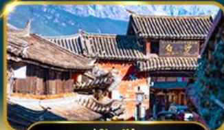
หมู่บ้านป๊อชา