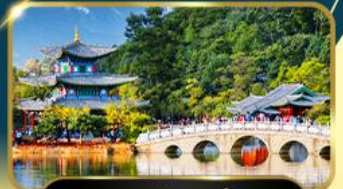
สะพานมิ่งกรดำ

นั่งกระเช้าขึ้นภูเขาหิมะมิ่งกรหยก • คุบเซาพระจันทร์สีน้ำเงิน • เมืองโบราณซูโฮ • ชมการแสดง Impression of Lijiang ของจางอ๋อโหมว