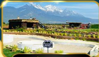
คาเฟ่ Yun Di An